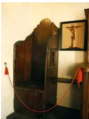
Confessionnal à ARS

Le saint Curé d'Ars n'ignorait pas les multiples réticences que pouvaient ressentir les pénitents pour s'approcher du confessionnal : méfiance à l'égard du prêtre, peur du regard des autres, découragement à l'idée de dire ses péchés, etc. Il avait, pour remédier à cela, disposé de façon très ingénieuse des confessionnaux un peu partout dans son église, dont un dans un lieu stratégique facile d'accès et discret, spécialement pour ceux qui appréhendaient le plus cette démarche.