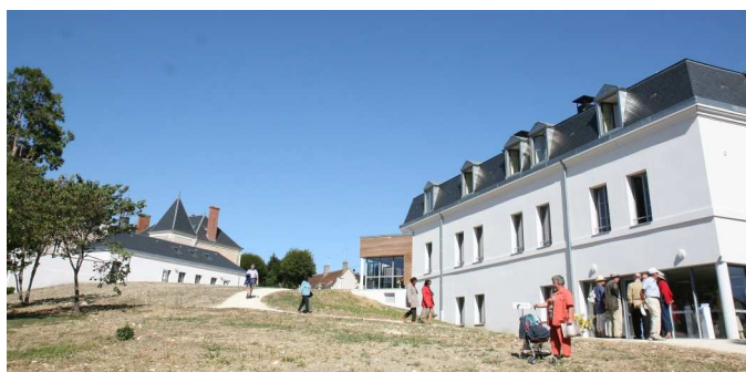
Soleil d'été resplendissant sur les nouveaux bâtiments