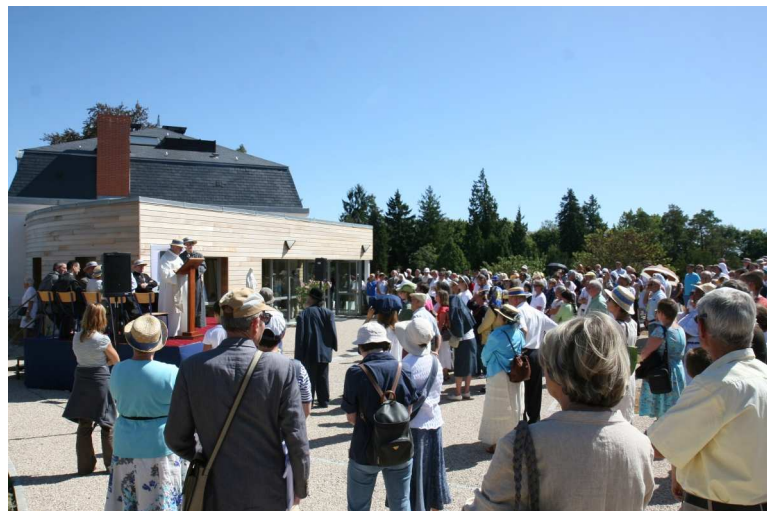
Discours et bénédiction sur le parvis devant un millier de pèlerins